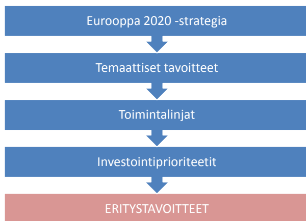
Kuva 1. Ohjelman interventiologiikan rakenne