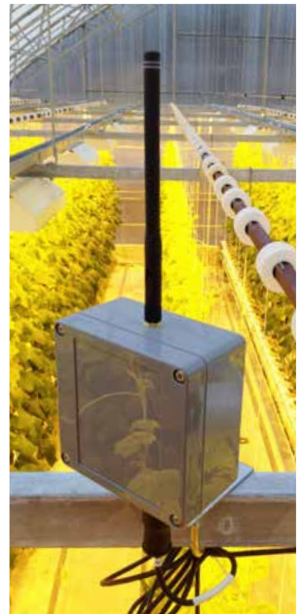
Justeringen av förhållandena i växthuset påverkar skördens omfattning. Trådlös teknik underlättar insamlingen av mätresultat.

I den andra delen av projektet undersöktes möjligheten att utnyttja förgasning av träflis för att producera värme och elektricitet i växthus. Dessutom har man tagit tillvara den koldioxid som uppstår som en biprodukt av förbränningen under förgasningsprocessen och försökt rena den med hjälp av katalysatorteknik så att den lämpar sig för användning i växthus.