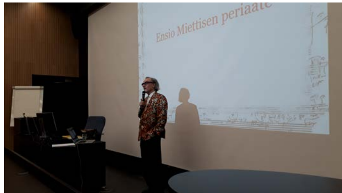
Hankkeen päätöseminaarin pääpuhujaksi saimme itse Prof. Esa Saarisen.