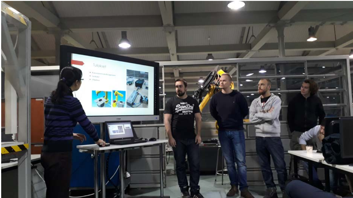
Kuvassa opiskelijat esittelevät projektinsa tulokset esitystilaisuudessa. Myös yritysten edustajat olivat paikalla.