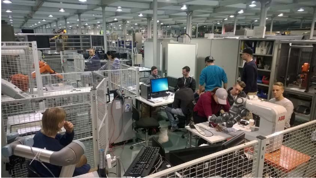
Vaasan AMK:n opiskelijat valmistelemassa yrityspilotteja koulun laboratoriossa.

Hankkeen aikana toteutettiin useita pilottikokeiluja, jotka toteutettiin pääosin opiskelijavoimin. Opiskelijat pääsivät ratkomaan yritysten robotiikkaan liittyviä ongelmia, sekä testaamaan robotteja uusissa sovelluksissa. Näitä pilotteja tehtiin jokaisen toimijan alueella ja palaute oli positiivista, niin opiskelijoiden, kuin yrityspuolen edustajien näkökulmasta.