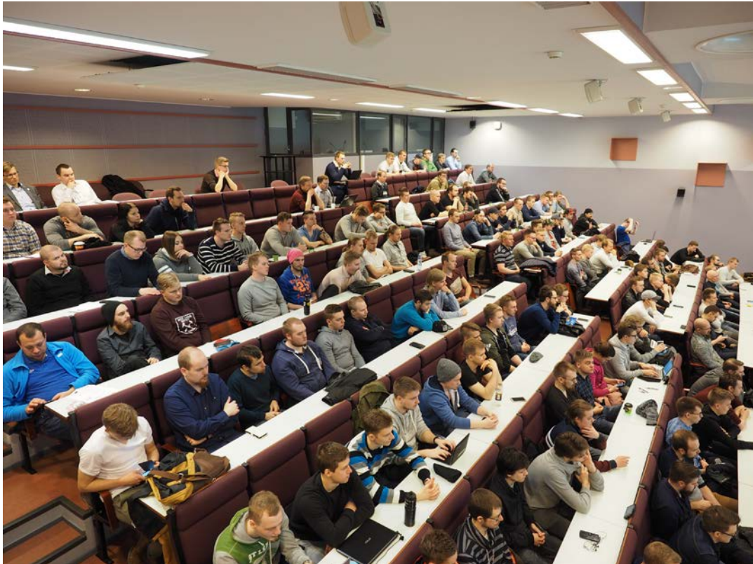
Kuva Turun seminaarista 12.4.2017 ja tupa oli täynnä. Lähes 200 osallistujaa.

http://www.morohanke.fi/seminaaritoteutukset/