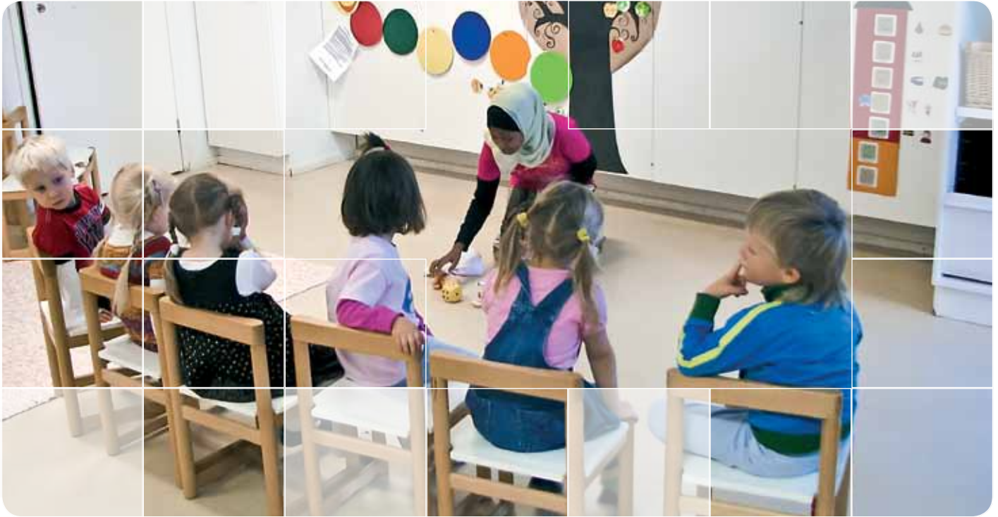
Inom projektet VaSkooli utvecklas en utbildningsgarantimodell för unga invandrare.