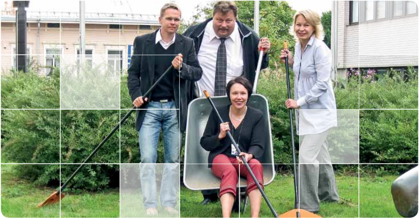
Det nationella KOTTI-projektet penetrerar företag från olika håll i Finland med hjälp av Yritysharava (Företagskrattan).