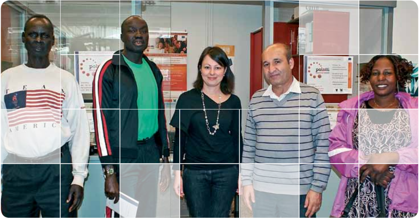
På rådgivnings- och vägledningsstället för invandrare i Södra Savolax går det ibland livligt till.