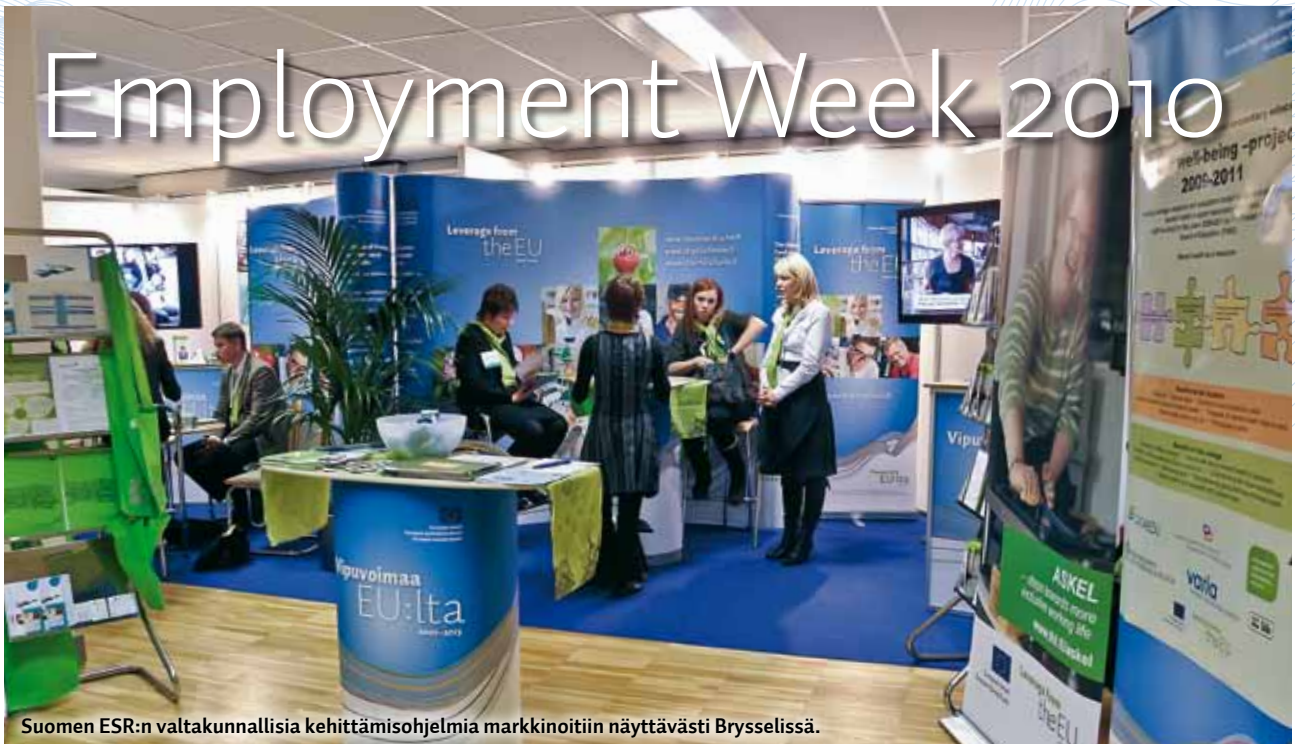
Suomen ESR:n valtakunnallisia kehittämisohjelmia markkinoitiin näyttävästi Brysselissä.

Employment Week on vuosittain Brysselissä järjestettävä konferenssi- ja messutapahtuma. Tänä vuonna 24.–25.11. järjestettyyn tapahtumaan osallistui yli 500 henkilöä ympäri Eurooppaa. EU 2020 -strategia oli näkyvästi esillä puheenvuoroissa. Päivien muut teemat liittyivät pääosin työllisyyskysymyksiin. Esillä olivat erityisesti muun muassa nuoret ja ikääntyvät. Lisäksi kiinnostusta herätti sekä puheenvuoroissa että näyttelyosastolla työperäinen maahanmuutto ja sosiaalinen syrjäytyminen.