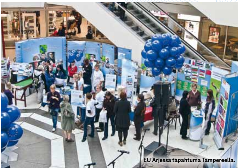
EU Arjessa tapahtuma Tampereella.