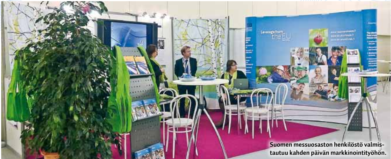
Suomen messuosaston henkilöstö valmistautuu kahden päivän markkinointityöhön.