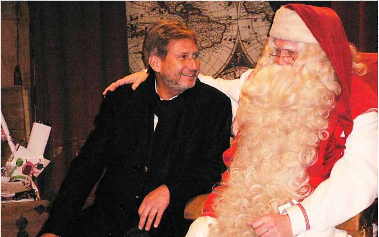
Komissaari Johannes Hahn tapasi myös joulupukkin.

Komissaari Johannes Hahn vieraili Suomessa 25.–27.2. ministeri Mauri Pekkarisen kutsumana. Vierailunsa aikana Hahn keskusteli EU:n alue- ja rakennepolitiikan uudistamisesta vuoden 2013 jälkeen.