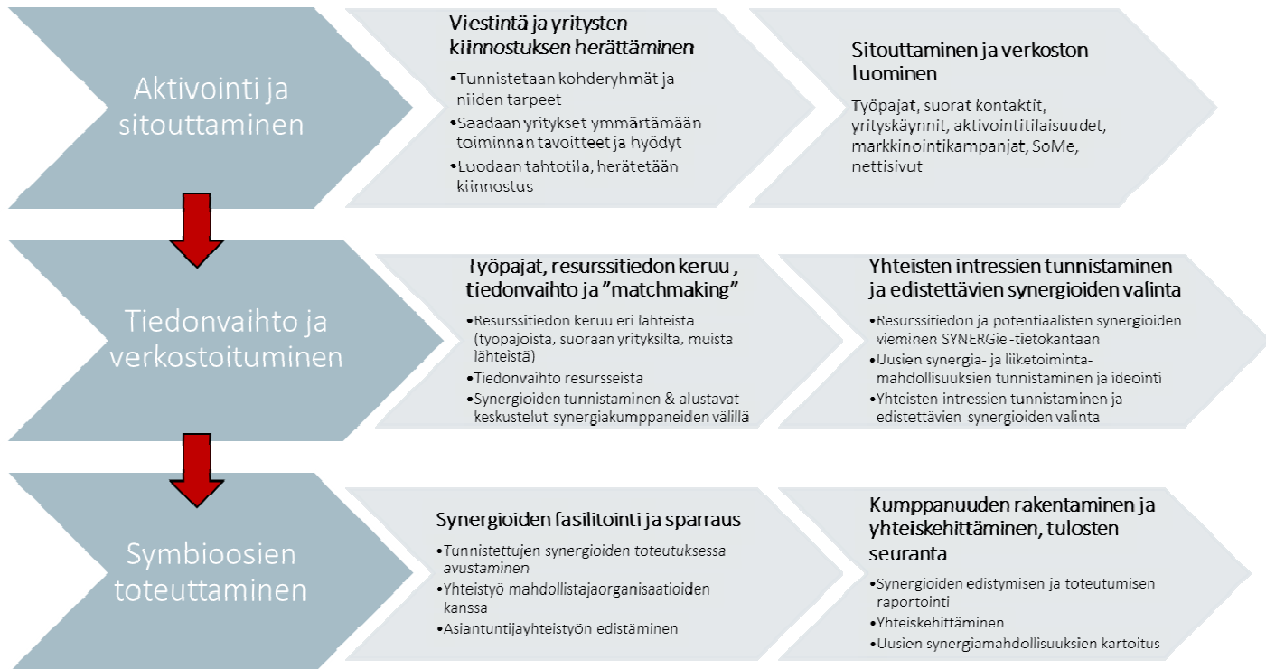
Kuva 3. Symbioosien edistäminen käytännössä.

alueiden välillä. Fasilitaattorit sparraavat yrityksiä uusien synergia- ja liiketoimintamahdollisuuksien tunnistamisessa ja ideoinnissa, sekä synergioiden käytännön toteuttamisessa mm. auttamalla yrityksiä löytämään uusia yhteistyökumppaneita asiantuntijoista ja mahdollistajaorganisaatioista.